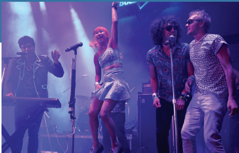
Le groupe musical French Horn Rebellion se produit sur scène au Doritos #BoldStage lors du festival de musique South by Southwest à Austin.

Austin est une ville ensoleillée, avec une moyenne de 300 jours de soleil par an et des températures en juillet et août autour de 24-36°C (95-99°F). Les hivers sont doux et relativement secs. Janvier et février sont les mois les plus froids, avec des températures moyennes de 9°C (49°F) et 12°C (53°F), respectivement.