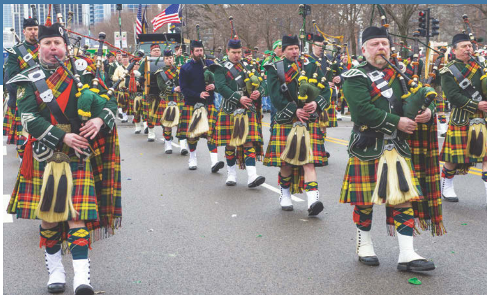
Tocadores de gaita de foles na Parada do Dia de São Patrício em Chicago

Chicago desfruta de estações distintas, mas geralmente evita os extremos do calor e do frio. As épocas mais agradáveis para visitar a cidade são a primavera e o outono. As temperaturas médias variam de 22 graus Fahrenheit (-6 graus Celsius) em janeiro a 74 graus Fahrenheit (23 graus Celsius) em julho.