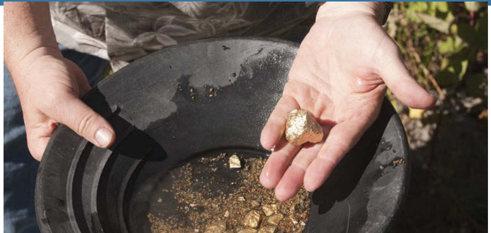
La prospection de l'or est toujours un passe-temps populaire.

Le climat de Denver est semi-aride et la ville profite d'une moyenne de 300 jours d'ensoleillement par an. Les hivers sont doux ; néanmoins il peut tomber entre 1,3 m et 1,6 m de neige d'octobre à avril à Denver.