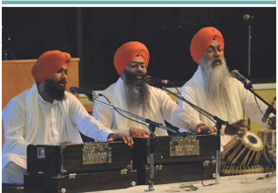
Хор исполняет традиционные гимны киртаны из священной книги сикхов в храме Тьерра Буэна.