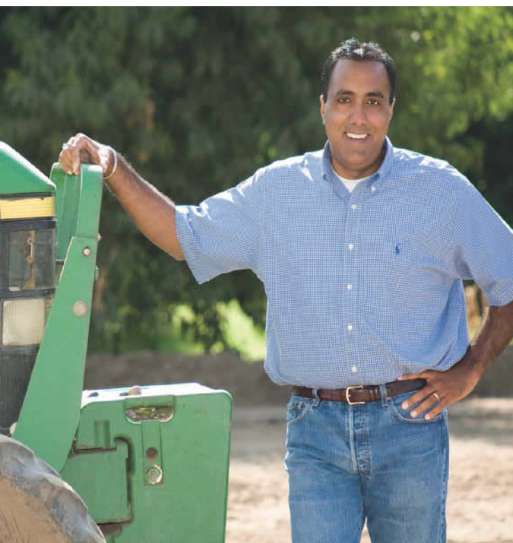
Банкир, фермер, член городского совета и бывший мэр, первый американский пенджабец, занявший эту должность в Юба-Сити.