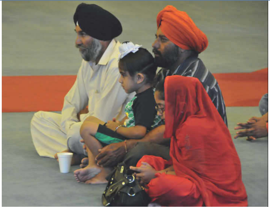
Семья присутствует на религиозной церемонии в сикхском храме Тьерра Буэна в Юба-Сити, штат Калифорния.

Пенджабско-американский фестиваль, проводимый каждый год в последнее воскресенье мая, организуется Пенджабско-американским обществом наследия, основанным в 1993 году для поддержки межкультурного понимания в сообществе. Фестиваль является светским празднованием пенджабской кухни, фильмов, музыки и танцев.